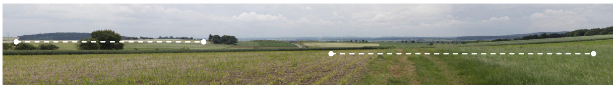
Blick von Norden auf das Vorranggebiet.

Die Linien stellen die Standortbereiche möglicher Anlagen im Vorranggebiet dar.