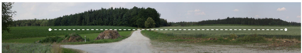
Blick von Südwesten auf das Vorranggebiet. Die Linie stellt den Standortbereich möglicher Anlagen im Vorranggebiet dar.