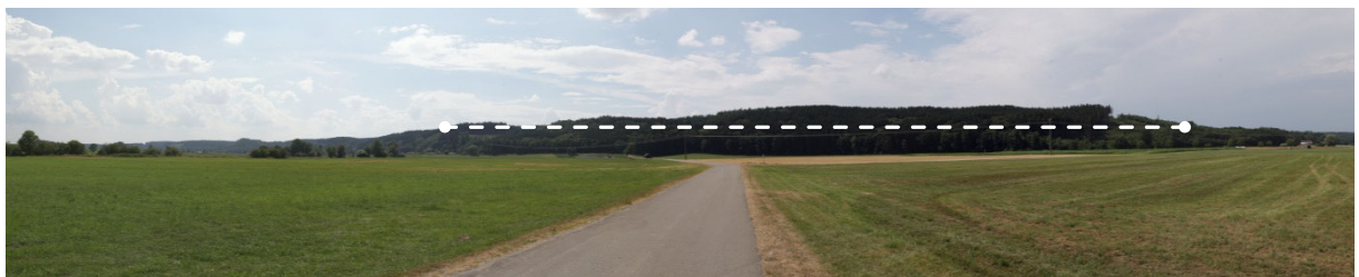
Blick vom Ortsrand Kettershäusen-Bebenhausen auf das Vorranggebiet. Die Linie stellt den Standortbereich möglicher Anlagen im Vorranggebiet dar.

Kurzcharakteristik: Nadel- und Mischwaldfläche, teilweise Agrarlandfläche auf einem Höhenzug zwischen Günz- und Rothtal. Umgeben von Mischwald sowie Agrarland.